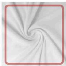
TELA PRINCIPAL Composición 100 % poliéster