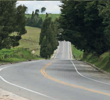
Servicio de inspección al mantenimiento y mejoramiento de la Vía Hatillo – Cauca Colombia

HMV Ingenieros desarrolla proyectos de transporte terrestre, fluvial y marítimo que se adaptan a difíciles características geográficas, topográficas y ambientales. Los servicios comprenden desde la identificación y realización de los estudios de factibilidad hasta la estructuración financiera, así como el desarrollo de la ingeniería básica, conceptual y de detalle, hasta la gerencia durante la ejecución, en proyectos relacionados con: