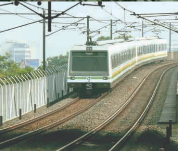
Asesoría y supervisión a los diseños, construcción, montaje y puesta en servicio del Sistema Metro de Medellín Colombia