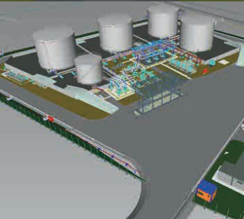
Ingeniería conceptual, básica y de detalle para el sistema de suministro de combustible tipo Jet al Aeropuerto El Dorado Colombia

HMV Ingenieros es especialista en ingeniería de facilidades de exploración y producción, procesos de separación de crudos, sistemas de transporte, plantas de refinación y tratamiento de gas y plantas petroquímicas, con servicios ofrecidos en esta área que parten desde el estudio de factibilidad y la ingeniería conceptual de la planta, hasta la ingeniería detallada, gestión de compras y gerencia de construcción del proyecto.