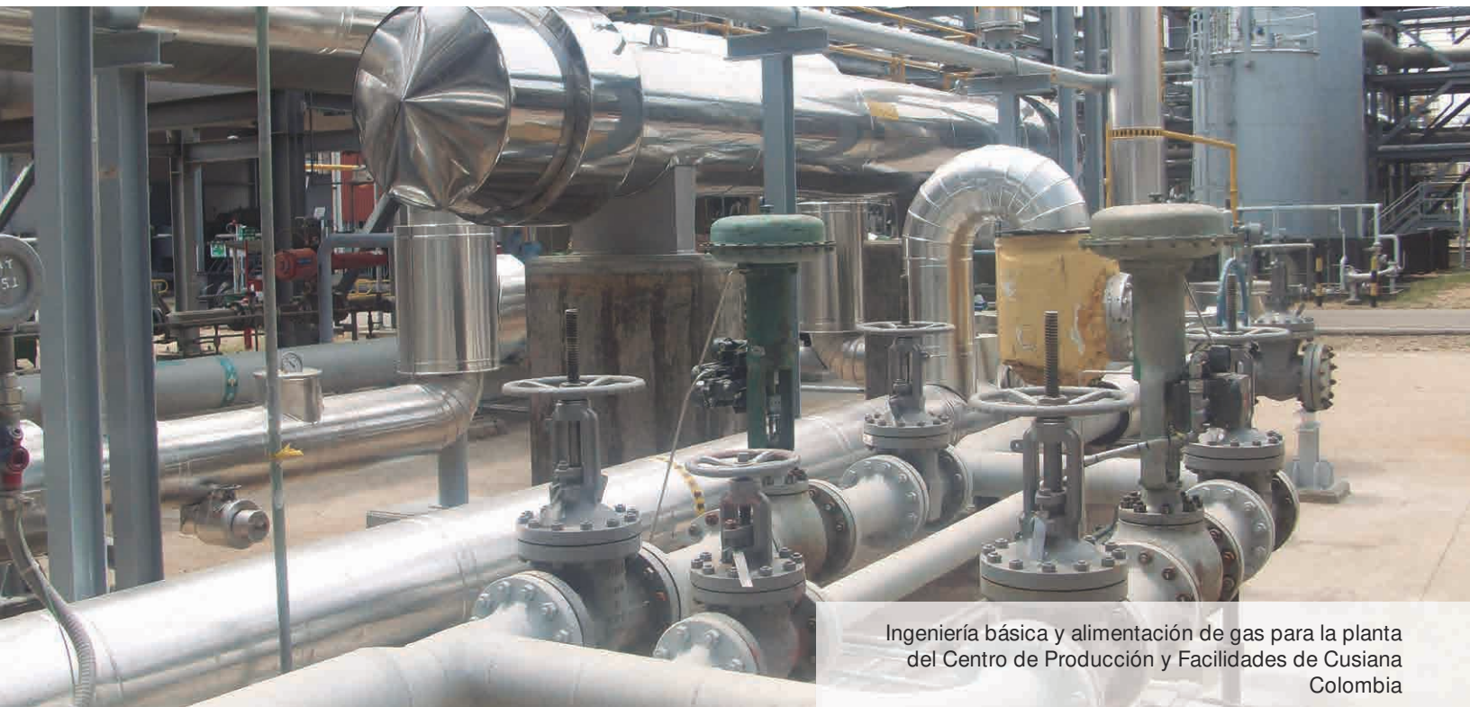
Ingeniería básica y alimentación de gas para la planta del Centro de Producción y Facilidades de Cusiana Colombia