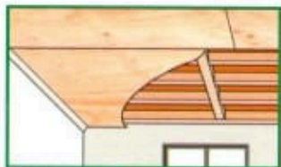
Selex B/C, uso en: revestimiento decorativo exterior e interior; en muros y cielos, y en decoración.