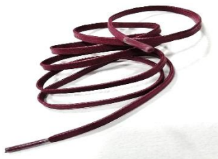
Cordón elaborado en textil con proceso de enserado