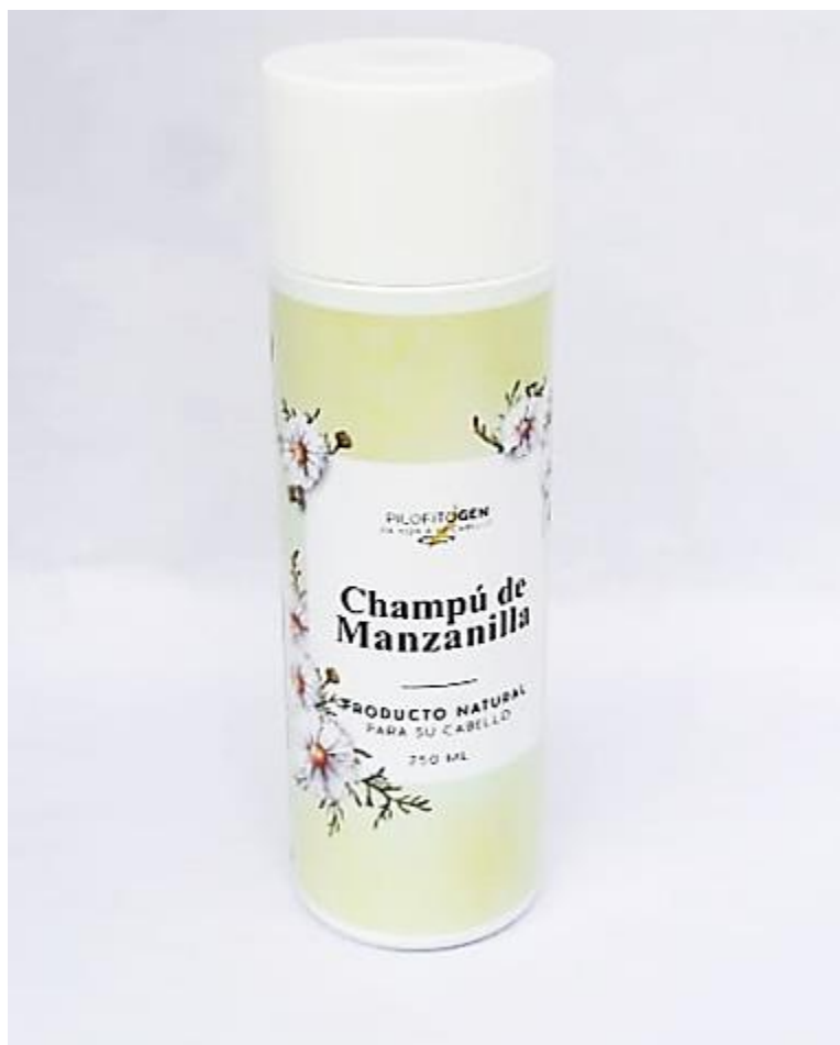
Presentación comercial del champú de manzanilla

Almacenamiento: Mantenga el producto en envase cerrado, tapado y en posición vertical en un lugar fresco, no exponer a los rayos del sol. Este es un producto estable, puede almacenarse hasta por un año siempre y cuando las condiciones sean óptimas.